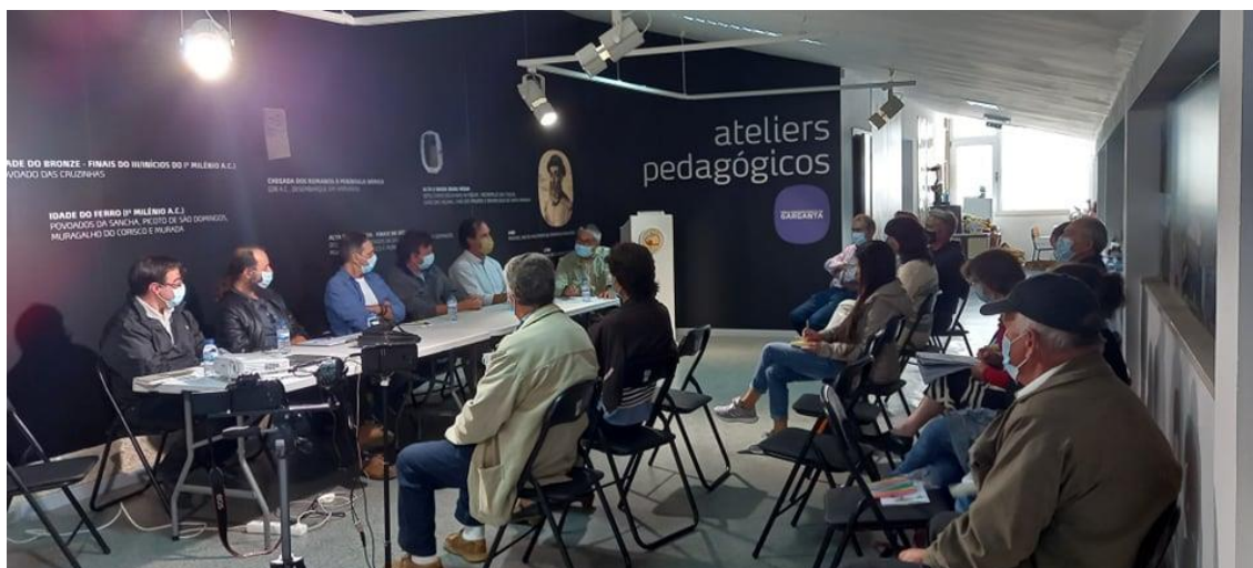
Imagem da tertúlia realizada no âmbito das Jornadas Europeias do Património 2021.