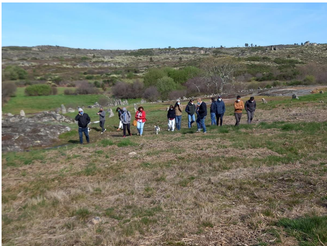
Fotografia do grupo na Necrópole Medieval das Touças.